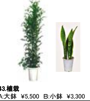
43.植栽 A:大鉢 ¥5,500 B:小鉢 ¥3,300