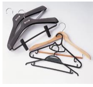
27.ハンガー [1本] ¥165