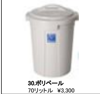
30.ポリペール 70リットル ¥3,300