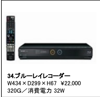
34.ブルーレイレコーダー W434×D299×H67 ¥22,000 320G/消費電力 32W