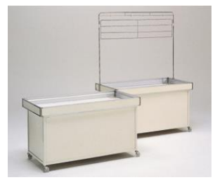
28.販売平台(A)・フェンス付(B) A:W1800×D750×H800 ¥11,000 B:W1800×D750×H1970 ¥15,400