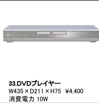
33.DVDプレイヤー W435×D211×H75 ¥4,400 消費電力 10W