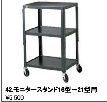
42.モニタースタンド16型~21型用 ¥5,500