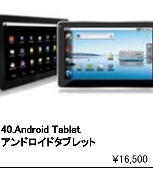
40.Android Tablet アンドロイドタブレット ¥16,500