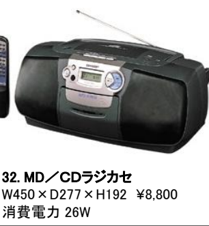
32. MD/CDラジカセ W450×D277×H192 ¥8,800 消費電力 26W