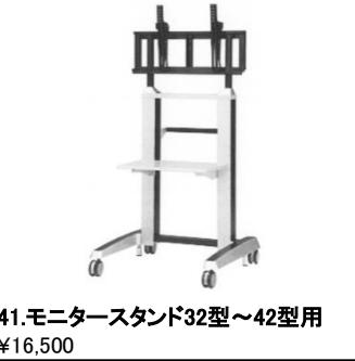
41.モニタースタンド32型~42型用 ¥16,500