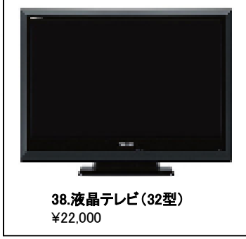
38.液晶テレビ (32型) ¥22,000