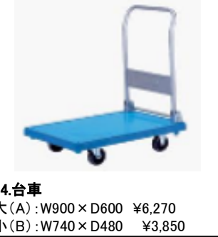
44.台車 大(A):W900×D600 ¥6,270 小(B):W740×D480 ¥3,850

※写真及びサイズはイメージになりますので、実物とは異なる場合があります。予めご了承下さい。 ※記載価格は会場までの配送料及び撤去時の返却送料を含みます。 ※展示スペースでの音出しは他のブースの方のご迷惑になる可能性がありますので規制させていただく場合がございます。 音の出るものを使用される場合は出展申込み時に、ご相談ください。