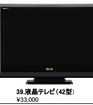
39.液晶テレビ (42型) ¥33,000