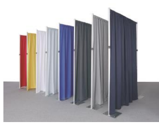
25.ドレープシステム 白(A)・赤(B)・青(C)・グレー(D) W1800~2800×H2400 ¥14,300