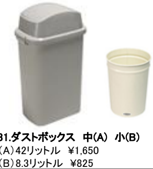
31.ダストボックス 中(A) 小(B) (A)42リットル ¥1,650 (B)8.3リットル ¥825