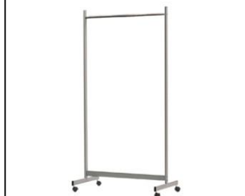
26.シングルハンガー W900×D500×H1600 ¥6,270