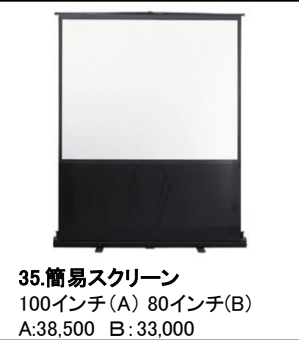
35.簡易スクリーン 100インチ(A) 80インチ(B) A:38,500 B:33,000