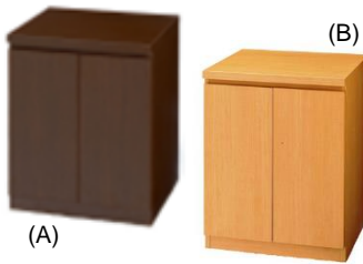
29.マルチ収納台 キャスター付 (A)ウエング (B)ナチュラル W600×D570×H700 ¥15,400