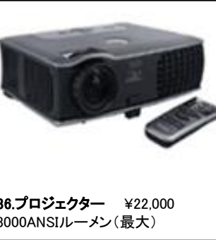
36.プロジェクター ¥22,000 3000ANSIルーメン(最大)