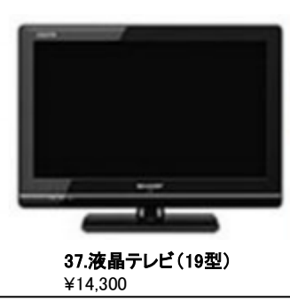
37.液晶テレビ (19型) ¥14,300